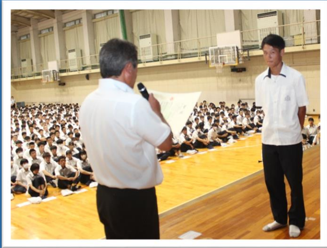
◎ソフトテニス部 男女とも個人戦で 全国5位入賞