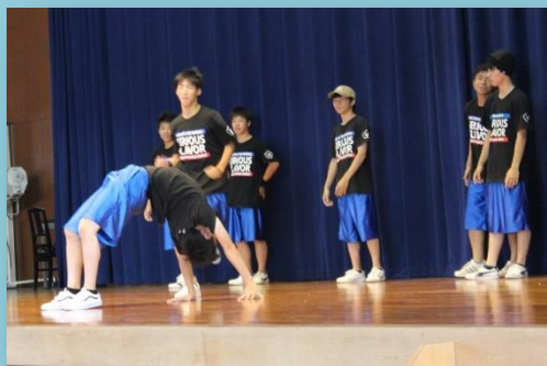
□全国大会発表作品 （スモールクラス）